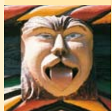
Veel laat-gotische patriciershuizen in Einbeck zijn versierd met fraai houtsnijwerk en »Neidköpfe«.