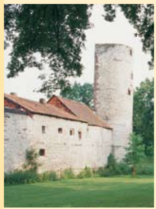
Stadsmuur met »Storchenturm« (ooievaarstoren).

Geniet van een verrukkelijk menu in een van de talrijke gezellige restaurants na een stadswandeling door de historische oude stad met de prachtig versierde en rijk beschilderde vakwerkhuisen. Einbeck heeft een uitgelezen hotellerie, pensions en vakantieverblijven.