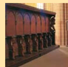
Het imposante eikenhouten koorgestoelte in de kolosale gotische kloosterkerk St. Alexandri.

De historische binnenstad nodigt uit om gezellig te winkelen en te flaneren. Maak eens een tocht met de fiets, auto of motor door de prachtige omgeving.