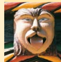
prydeornamenter og ansigter smykker fasaderne på de sengotiske borgerhuse