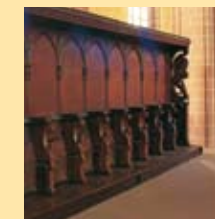
den mægtige korstol i den store gotiske Münsterkerke