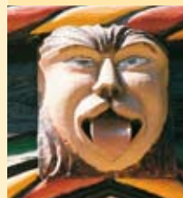
prydeornamenter og ansigter smykker fasaderne på de sengotiske borgerhuse