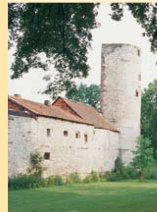
bymur med storketårn

På en rundtur gennem den historiske gamle bydel med deres rejsefører passeres farveprægtige bindingsværkshuse, efterfølgende kan der nydes et udsøgt menu i en af de talrige hyggelige restauranter. Einbecks velplejede hoteller, gæstgiverier og ferielejligheder indbyder til ophold i fred og ro.